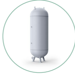
Yüksek basınçlı tanklar