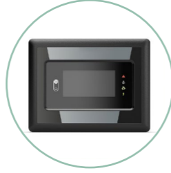
ECO6i çok üniteli kontrol sistemi