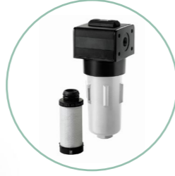
Yüksek basınçlı hat filtreleri